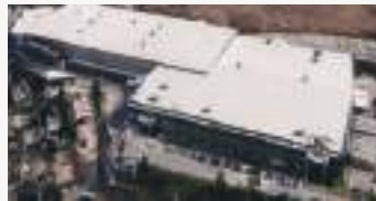
북중미 범진전자 사출성형 (North, Central and American BUMJIN)