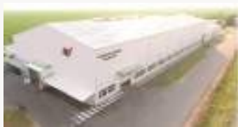
헝가리 범진전자사출성형 (Hungary BUMJIN)