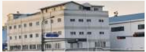
한국수원 범진사출 (Korea Suwon BUMJIN Injection Molding)