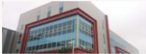
한국수원 범진금형 (Korea Suwon BUMJIN MOULD)