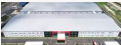
베트남 범진 (Vietnam BUMJIN)