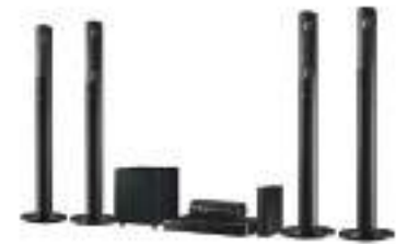
Home Theater System