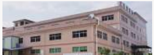
중국 해주 범진 과기 (Chinese Hyeju BUMJIN)