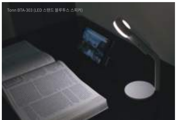
Tonn BTA-303 (LED 스탠드 블루투스 스피커)