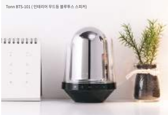
Tonn BTS-101 (인테리어 무드등 블루투스 스피커)