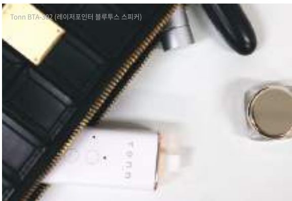
Tonn BTA-302 (레이저포인터 블루투스 스피커)