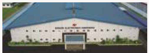
인도네시아 범진전자 (Indonesia BUMJIN)