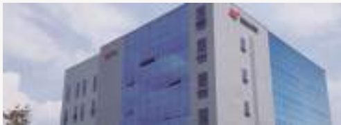
한국수원 범진 (Korea BUMJIN HQ building)