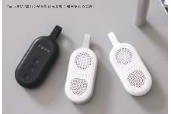
Tonn BTA-301 (아웃도어용 생활방수 블루투스 스피커)