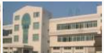
중국 동관 범진공업 (Chinese Dongguan BUMJIN)